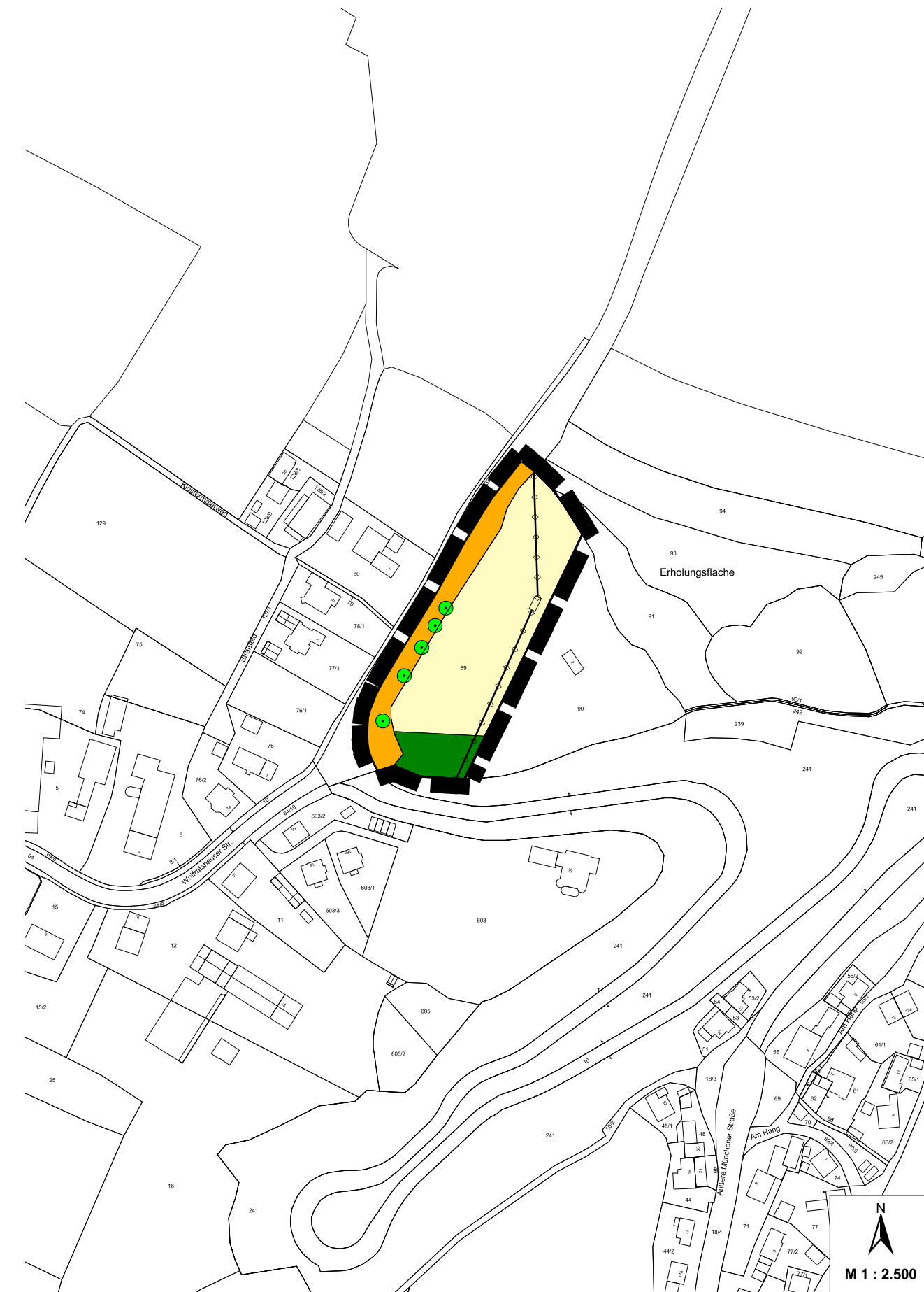
Rechtswirksamer Flächennutzungsplan der Gemeinde Icking vom 05.03.1992